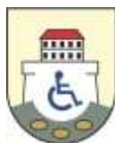
Udruga tjelesnih invalida Bjelovar